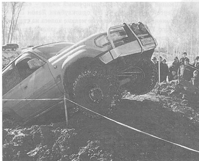
▼ Первому всегда трудно

...Не ошибается тот, кто ничего не делает. Надеемся, по мере приобретения опыта джип-триал (а в перспективе и трак-триал) приживутся в Новосибирске. •